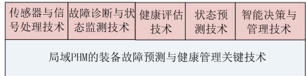
Figure 2. Key technology of fault prognostics and health management for equipment 图 2. 装备故障预测与健康管理的实现关键技术

PHM 对传感器技术的要求是：小、轻、容易与系统上预处理单元联网，能够适应恶劣的工作条件和环境，不易受电磁干扰的影响等。其常用的先进测试传感器有光纤传感器、无线传感器、虚拟传感器、智能传感器和压电传感器以及新型微机电系统(MEMS)等 [11] 。目前，对这些传感器的研究主要从三方面展开：一是对传感器性能进行优化；二是研究如何减小传感