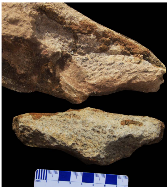
Figure 3. The scale impressions of the above ankylosaur specimen (scale bar: 8 cm)