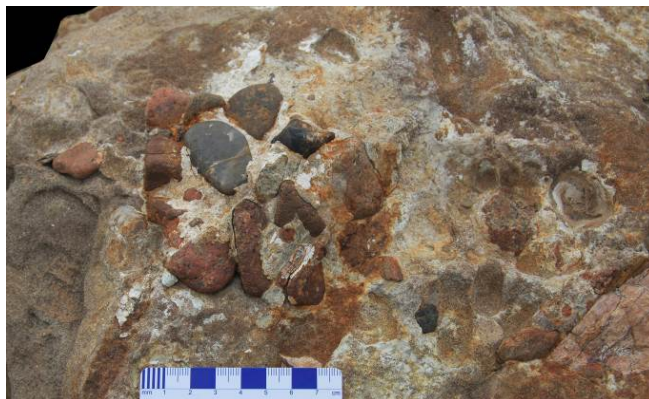
Figure 2. The gastroliths of the above ankylosaur specimen (scale bar: 8 cm)