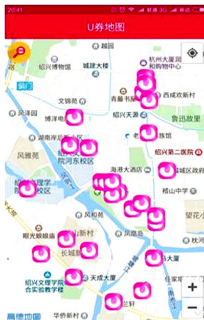
Figure 2. Screenshot of nearby merchants 图 2. 附近商家截图