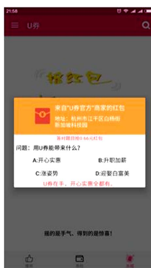
Figure 1. Q & A red envelope screenshot 图 1. 问答红包截图

在广告精准投放 APP 软件中，如图 1 问答红包截图所示，用户在获得现金红包或者优惠券前需输入对应的店铺名称，这样就加深了用户对这家店铺的印象，且有了优惠券，用户也会更欣于去该店铺消费。