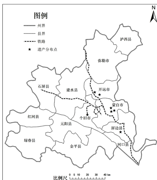
Figure 1. Distribution map of some industrial heritage in Honghe area

近年来，丰富的旅游资源使得红河州旅游业发展较快。据云南省统计年鉴(2018 年)，红河州全州旅游总收入 514.12 亿元，占全省旅游总收入的 7.4%，比 2017 年的旅游总收入增加了 54%，同比增长 87.2%；2018 年接待旅游者共计 4823.72 万人次，占全省接待游客总人次的 8.4%，同比增长 37.2%。其中红河州工业遗产旅游资源丰富、数量众多，近年来工业文化遗产旅游活动也受到人们的重新认识和关注。