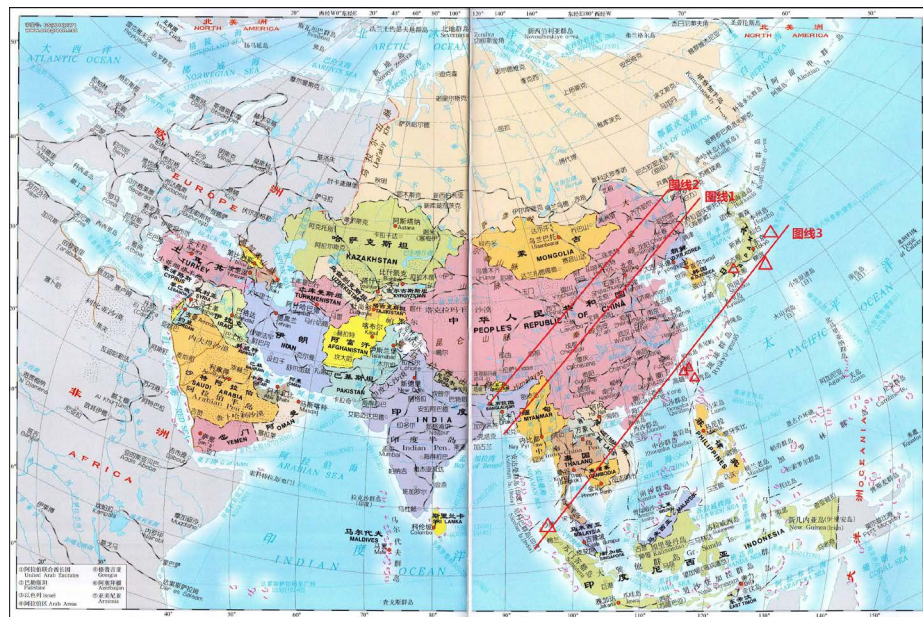
Figure 2. A schematic diagram of the 2H three parallel lines (line 1, line 2 and line 3) of the great earthquake in China 图 2. 中国大地震 2H 三平行线示意图