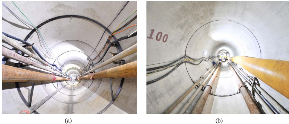
Figure 1. The traditional (a) and improved (b) pipe racks 图1. 传统(a)、改进(b)管道支架

传统管道支架为整环扁铁焊接结构,该结构需外围加工,成本高,组装时间长,泥浆管需固定在1m高处,接续在工作井内进行,无自动化装置,每次管道接续至少需8人协同作业,工效较低。为充分利用隧道空间,对管道支架进行了改造,仅管节下部1/3圆空间作为管道支架支撑结构,管道支架通过螺栓与木垫片连接(图1)。