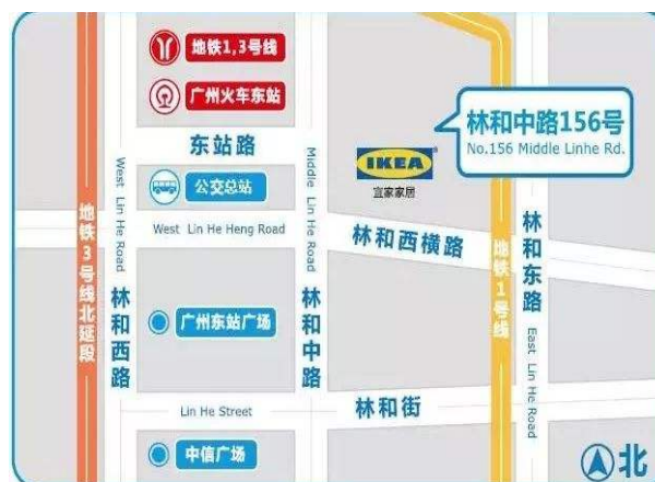
Figure 2. The location of IKEA Guangzhou

而广州番禺宜家商城, 位于广州市番禺区东艺路, 附近有新光快速, 光明高速和番禺大道, 交通也是非常便利。