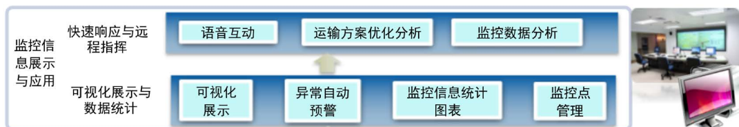
Figure 4. Material Transportation Visualization 图 4. 物资运输可视化

与此同时，如图 4 所示，根据不同物资类别，不同业务环节，不同的监控数据通过设置不同等级的预警阈值对各模块监控参数进行可视化监控预警，并在控制中心进行全范围实时可视化展示，同时对位置信息、状态信息、告警信息进行分类处理，将告警信息第一时间进行系统自主处理，并通知后台进行异常处理方案的执行。