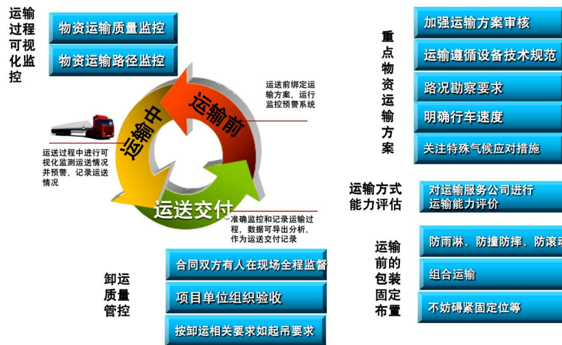
Figure 1. Key management requirements in the three links of quality control of materials transportation 图 1. 物资运输质量管控三个环节中的重点管理要求

本文应用智能传感器信息采集技术、GPS/北斗定位技术、Wi-Fi 传输技术、RFID、科学可视化等智能物联网技术对物资运输过程的物资状态参数、运输路径跟踪、物资周界视频监控进行数据的全面收集，针对不同物资类别、不同项目类型、不同业务环节设计不同的监控参数与数据收集模块，对物资供应的全程进行全方位、多维度的物联网应用[4]。