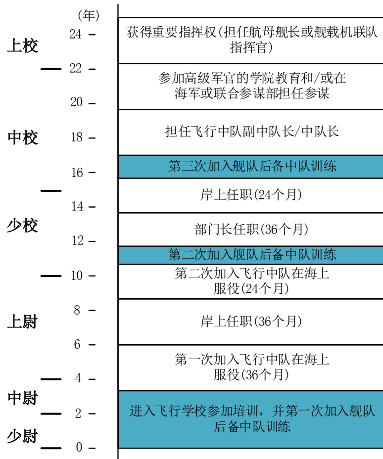
Figure 1. Occupation route of carrier captain and Air Wing Commander 图 1. 航母舰长与航空联队指挥官的职业路线

技术军官和准尉通常作为技术管理人员和技术专业人员。这类军官有 60 种专业, 对于这些专业没有设定培养路线。这类军官通常在本领域内持续工作, 这点与有任职限制军官和事务军官类似。